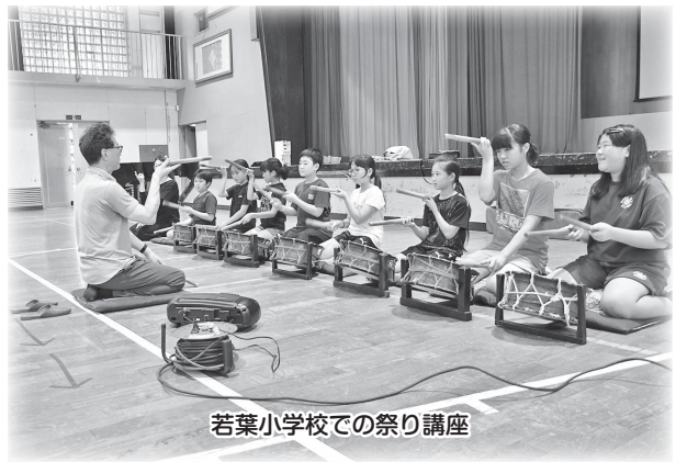
若葉小学校での祭り講座

昨年の夏、歴史民俗資料館の主催による「祭り担い手育成事業」が実施されました。この事業は、祭り文化の継承を目的に、こどもたちが祭りに参加するきっかけを提供するために企画したもので、町内の祭典部と連携し、祭りについて学ぶ講座や山車づくりを体験する講座が開催されました。