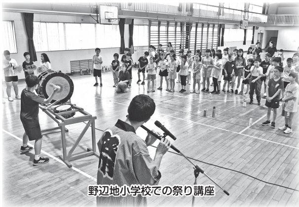
野辺地小学校での祭り講座

発行／野辺地町教育委員会 Tel 0175-64-2119 Fax0175-64-8083