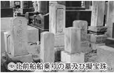
④北前船乗りの墓及び擬宝珠