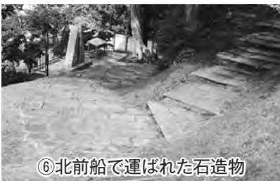
⑥北前船で運ばれた石造物

構成された町の文化財は、浜町の常夜燈や旧野村家住宅離れ（行在所）など8つ。これまでも、町の北前文化を象徴する文化財としてPRしてきましたが、今後はさらに観光を浴びることとなり、更なる観光振興への効果が期待されます。 【町の日本遺産構成文化財】 ①浜町の常夜燈、②旧野村家住宅離れ（行在所）③末社金刀比羅宮本殿、④北前船船乗りの墓及び擬宝珠、⑤北前船関係資料群、⑥北前船で運ばれた石造物、⑦のへじ祇園まつり、⑧茶がゆ