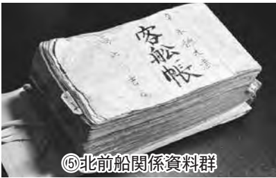
⑤北前船関係資料群