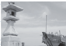
写真⑥ 平成30年5月撮影