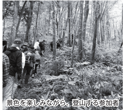
景色を楽しみながら、登山する参加者

登山の際は、三番橋に設置された「入山箱」に必要事項を明記のうえ、挑戦してみたいはかがでしょうか。