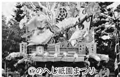
⑦のへじ祇園まつり