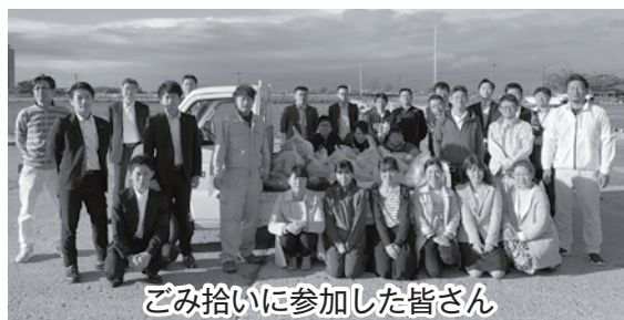
ごみ拾いに参加した皆さん

6月13日、野辺地町商工会青年部、野辺地町金融団（青森銀行・みちのく銀行・青い森信用金庫）、ジャムフレンドクラブ野辺地の従業員ら総勢30人が、潮騒公園の清掃活動を行いました。