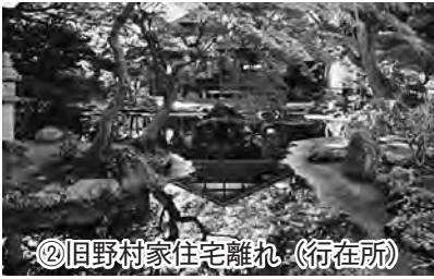
②旧野村家住宅離れ（行在所）