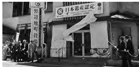
認定記念セレモニーでの除幕の様子