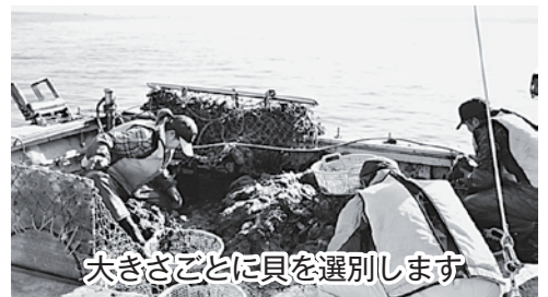
大きさごとに貝を選別します