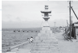
写真③（昭和39年8月役場広報撮影）