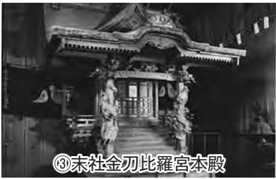
③末社金刀比羅宮本殿