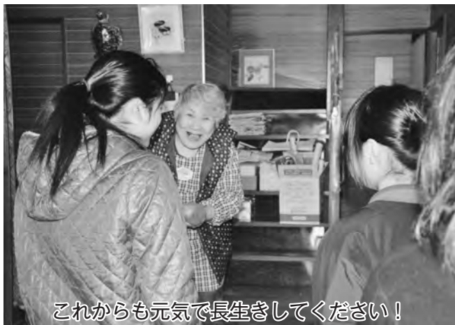
これからも元気で長生きしてください！

1月28日、在学青年ボランティア会に所属する高校生12人（野辺地高校6人、野辺地西高校6人）が、町内の一人暮らしの高齢者宅を訪問し、除雪や手作りのお菓子をプレゼントするボランティア活動を行いました。 当日は、高齢者宅2軒の玄関先や、車庫・裏口の除雪を行い、その後、5軒の高齢者宅に手作りの蒸しパンや大学芋、メッセージカードなどをプレゼントしました。 当会は、地域交流やボランティア精神の育成を目的に様々な活動を行っています。今年度を締めくくる最後の活動で、普段触れ合うことが少ない高齢者との交流にお互い笑みがこぼれていました。