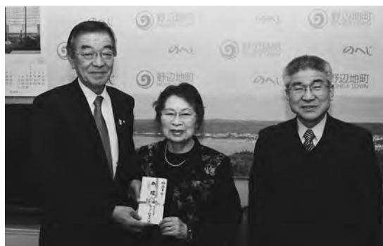
有戸はまなすふれあいセンター利用者一同様より 有戸はまなすふれあいセンター 維持管理費として150,000円