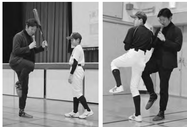
直接指導にドキドキ

児童・生徒たちは、憧れの選手を前に、緊張しながらも真剣に学び、夢のような時間を楽しんでいました。