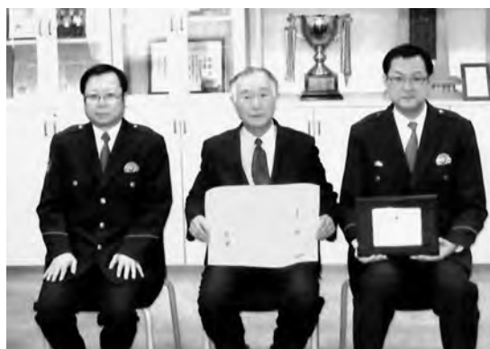
全国交通安全優良団体等表彰 優良交通安全協会 野辺地地区交通安全協会