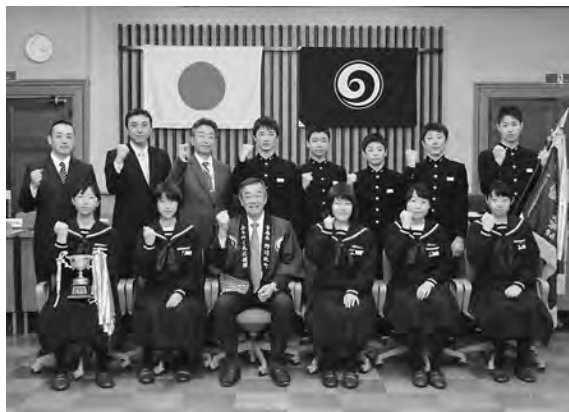
野辺地中学校 スキ一部