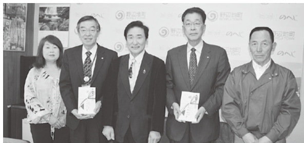
新舞踊一の会様より(チャリティーショー益金) 町のため、教育のために100,453円