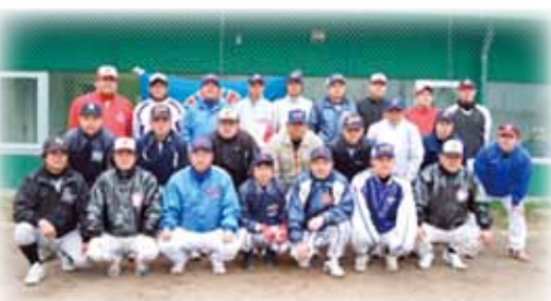
野球協会選手会・OB会のみなさん

野辺地野球協会は昭和23年に発足しました。町内職場対抗野球大会も同年に始まり、日曜日を利用して対抗戦が頻繁に行われ、野辺地野球協会は日々力をつけていきました。昭和26年には県大会を制し、当時社会人野球の目標であった天皇杯全日本軟式野球大会に出場するなど輝かしい歴史があります。現在も選手会はじめ、審判部、壮年野球、還暦野球など活発に活動しています。