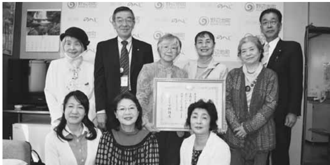
朗読の会「秋桜」のみなさんと中谷町長・古田教育長