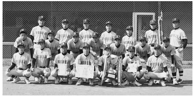
3年ぶりの優勝を果たした野中野球部

4月28日・29日の二日間、標記大会が野辺地町営球場で開催され、野辺地中学校が3年ぶり6回目の優勝を勝ち取りました。 野辺地中学校は1回戦、準決勝と順調に勝ち上がり、決勝は東北中学校と対戦し、3対1で見事優勝しました。 野辺地中学校監督は「一次のプレーを考へられるようになってきた。さらに先を読んだゲームメイクができるようにしたい」とコメントしていました。