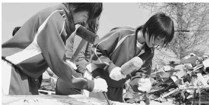
ノミいれをする生徒たち