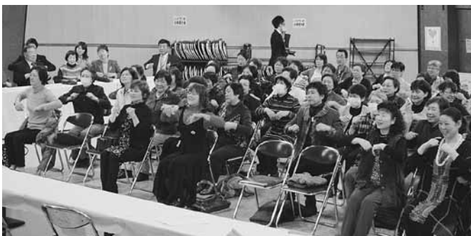
3B体操を体験する受講者たち