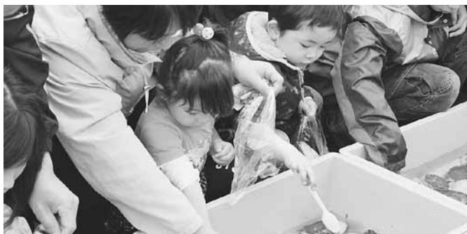
ホタテすくいに夢中になる子供達