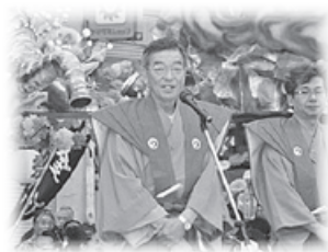
あいさつする中谷町長