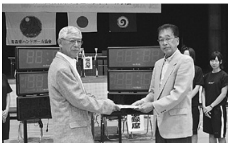
青森県ハンドボール協会様より タイマー購入のための寄付