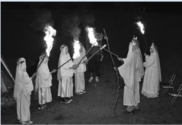
キャンプファイヤー 火の神、火の女神から分火

7月28日～29日にかけて、柴崎観光牧場拓心館周辺で子ども会わくわくキャンプが開催され、町内の子ども会会員3年生～6年生の中から23名が参加しました。