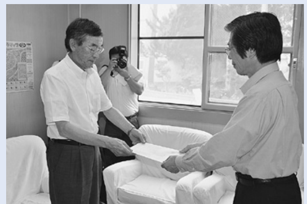
商工会会長へ要望書を提出