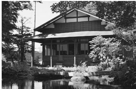
旧野村家住宅離れ (行在所)

平成20年7月に、国の登録有形文化財に指定された「旧野村家住宅離れ」、いわゆる行在所の改修事業は、平成21年度から、東日本鉄道文化財団の地方文化事業支援と野辺地町文化財を守る会をはじめ、多くの町民の皆