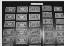
税関で保管している紙幣

返還の請求はご本人だけでなくご家族の方々でも構いません。お気軽に最寄りの税関までお問い合わせください。