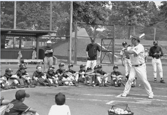
バッティング指導