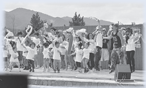
ダンスチーム「クラウド」