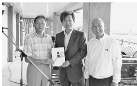
みちのく銀行野辺地支店 みちのく会様より町スポーツ振興費として