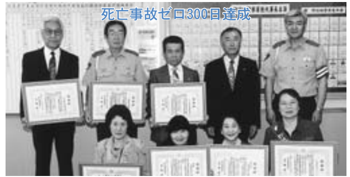
野辺地警察署管内（野辺地町・横浜町・六ヶ所村） 3か町村関係者のみなさん