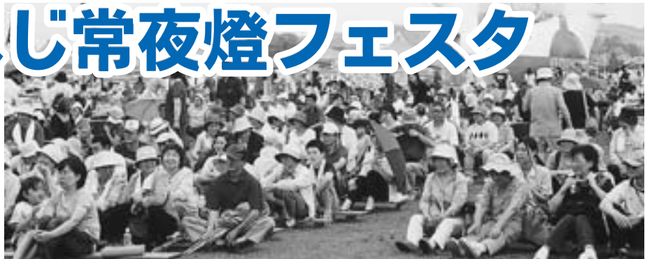
大勢の来場者で賑わった'09常夜燈フェスタ