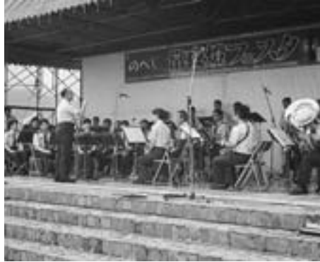
航空自衛隊 北部航空音楽隊演奏