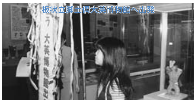
板状立脚土偶大英博物館へ出発