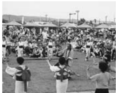
来場者も参加しささ踊り