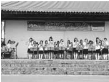
オープニングを飾る若小マーチングバンド