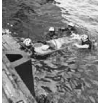
海上保安庁・消防署による水難救助訓練