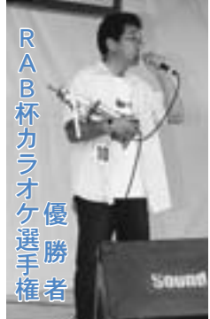
RAB杯カラオケ選手権 優勝者