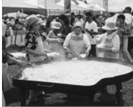
のへじ名物味噌貝焼き