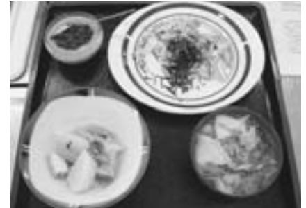
*左下がこかぶのごまみそ煮