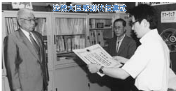
法務大臣感謝状伝達式