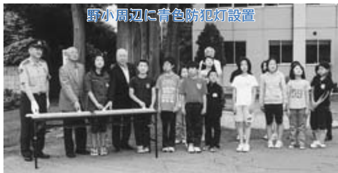
野小周辺に青色防犯灯設置