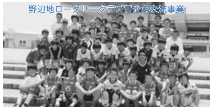
埼玉スタジアム前にて