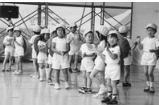
わかば保育園による「亀さん音頭」