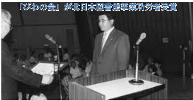
亀田町長が代読し、熊谷会長へ表彰状を渡す