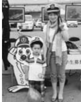
海上保安庁!? それとも消防署!?