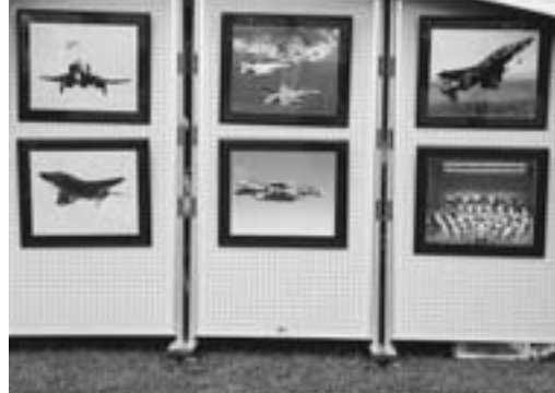
自衛隊は君を待っている!