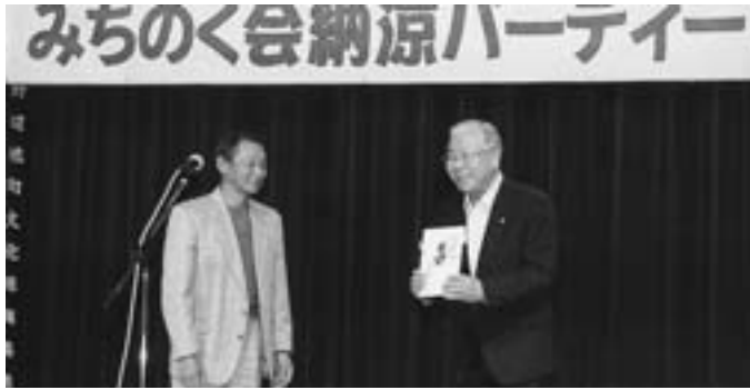
「みちのく会」が収益金を寄付 野村会長より目録を受取る亀田町長（右）