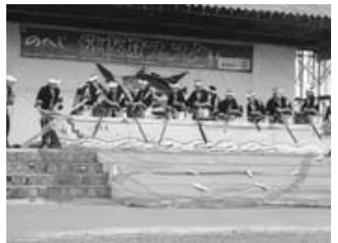
沖揚げ音頭を披露