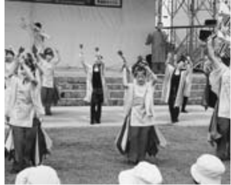
YOSAKOI “よっちょれ” みんな集合!!