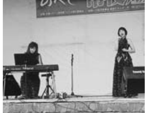
サエラ歌謡ショー