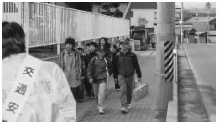
元気にあいさつを交わす小学生