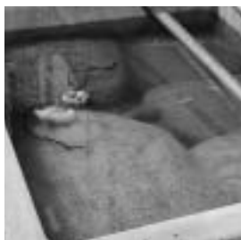
種もみも準備万端

専門農家で妻と二人で、田畑作業をこなす。繁忙期には、作業員を一人雇う。三世同居し孫の成長が仕事への励み。また、川目自治会長として、地域のまとめ役に徹し多忙な毎日を送っている。