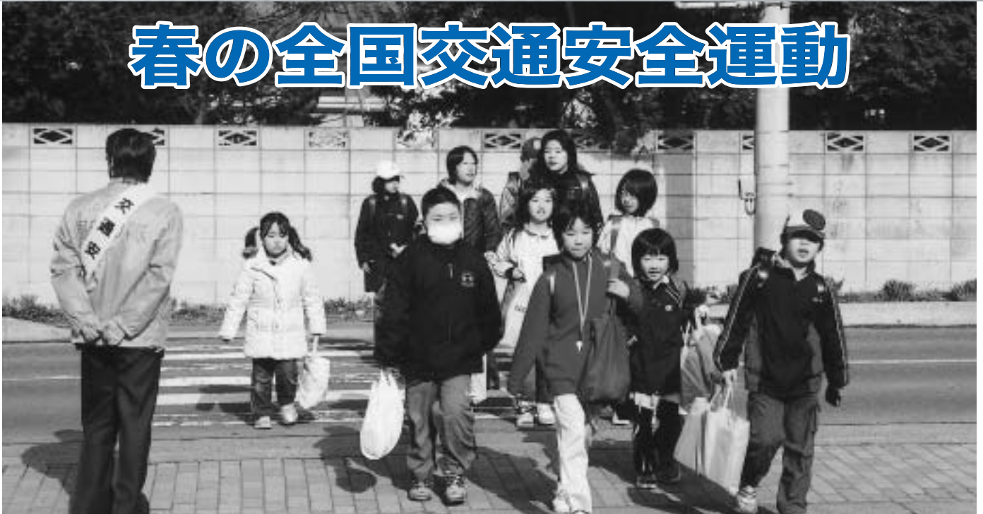
低学年・高学年 みんな一緒に登校