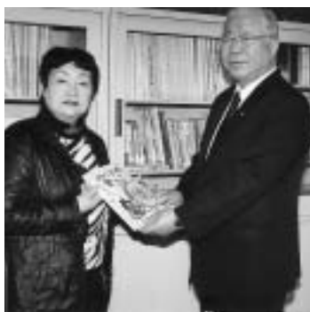
完成品を受け取る亀田町長(右)

うPRに努めるとともに、保育園・幼稚園、小・中学校等に配布して、読み聞かせの場を幅広く増やしていきたい」とお礼の言葉を述べました。