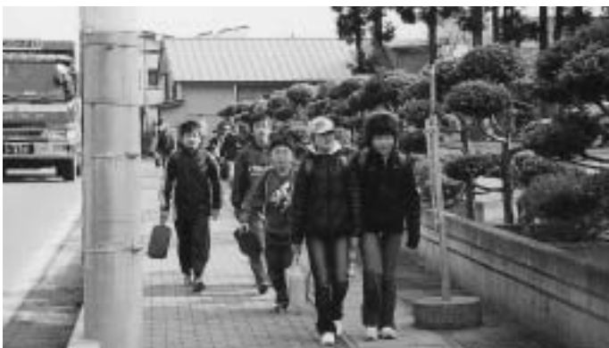
みんな元気ですか～!!