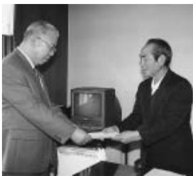
計画書を受け取る亀田町長(左)

「予算的な問題で出来ないこともあるかもしれないが、やれるものから着実に取り組みたい」と述べました。