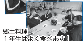
郷土料理 1年生はよく食べます!!