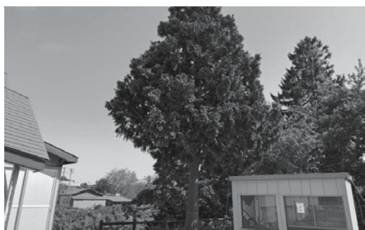
昭和52年5月植樹の「国体記念樹」(中央公民館駐車場付 近)記念植樹時の写真ありませんか(写真は現在の記念樹)

当町での青の煌めきあおもり国スポ開催に伴い、昭和52年開催の「あすなる国体写真展」を実施し、町民とともに、大会の盛会を目指します。「あすなる国体野辺地町関連写真」をお持ちの方は、写真の貸出にご協力をお願いします。展示は、8月上旬から中央公民館、大会期間中は野辺地高校生徒会館を予定しています。