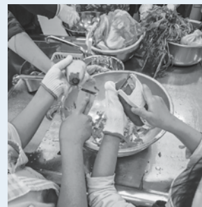
食育の次はランチ作り