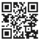
定住自立圏観光ガイド QRコード