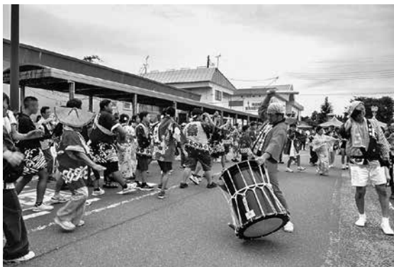
【写真⑤のへじ祇園まつりでのササ踊り 撮影日：2025(令和7)年】 現在のササ踊り。のへじ祇園まつり等で披露されています。

【野辺地のササ踊り】：野辺地町で行われている盆踊りの名称。南部地方の盆踊りと類似性を持つ踊りと盆唄である。昔は盆の前後1週間にササ踊りが行われていたが、現在はのへじ祇園まつりや町のイベントなどで行われている。踊りが始まった時期は不明だが、少なくとも明治20年代には行われている。場所は、お寺や神社の境内、愛宕公園、町内会の空き地等で行われた。昔は各町内会等が盆に合わせて行ったが、現在はササ踊り保存会が中心となっている。