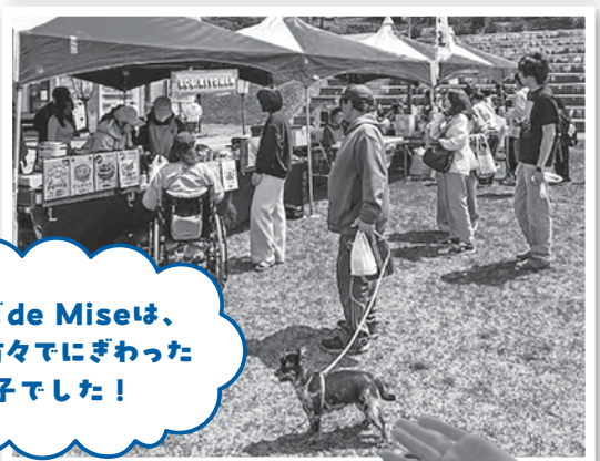
あたご de Miseは、多くの方々にぎわった様子でした!