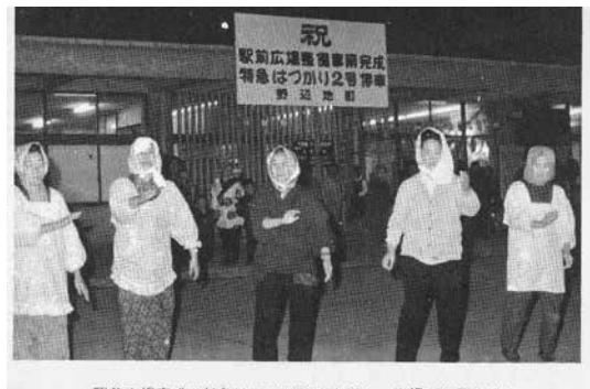
【写真④駅前広場整備とササ踊り 撮影日：1970(昭和45)年】 広報のへじより。駅前広場完成を祝い踊っています。

【解説】 盆踊りとは、盆の時期に先祖を供養する行事、またそこで行われる踊りを指します。日本各地で古くから伝わる地域性のある盆踊りが行われており、当町ではササ踊りが行われています。 ササ踊りは、現在はササ踊り保存会が中心となり、のへじ祇園まつりや町のイベント等で行っていますが、かつては各町内会で行われていました。時期は、戦前は8月7日～20日、戦後は盆の前夜1週間に行われました。昔はお寺や