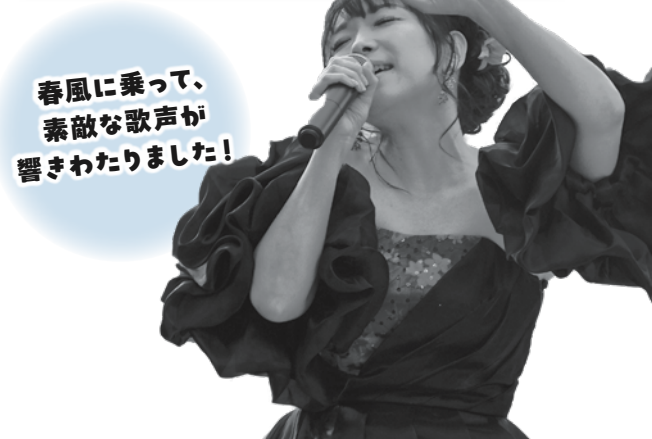
春風に乗って、素敵な歌声が響きわたりました!