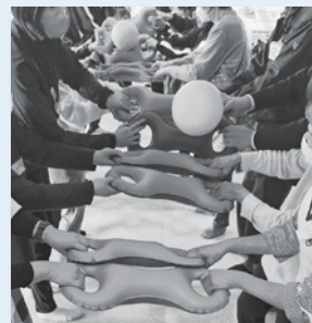
3B体操！ベルを使ったボール運びは大盛り上がり♪

※春休み子ども食堂は、赤い羽根共同募金助成金（令和7年度協働募金多様化する生活課題に即応する助成事業）を活用して実施しました。