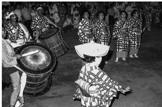
【写真③ササ踊り 撮影日：1969(昭和44)年】 大勢の観客が見ている中でのササ踊り。手前の締太鼓は現在の太鼓に比べて一回り大きいようです。