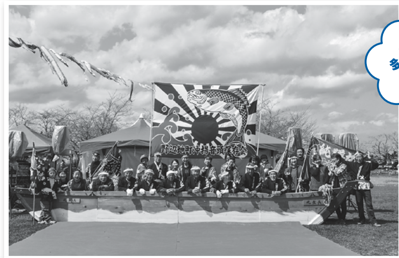
野辺地町沖揚げ音頭保存会の方々に記念撮影を行いました!