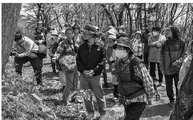
講師と一緒に植物を観察する参加者の皆さん

歴史民俗資料館が5月3日、歴史講座「愛宕公園さんぽー園内の文化財と動植物をみてみよう」を愛宕公園で開催しました。