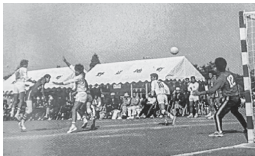
1977年(昭和52年)あすなる国体ハンドボール競技 野辺地高等学校グラウンド