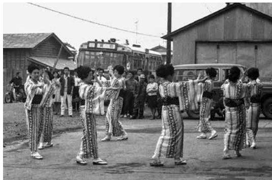
【写真②ササ踊り 撮影日：1968(昭和43)年】 撮影場所は町役場前。おそろいの浴衣を着ているので、踊り手はササ踊り保存会の皆さんでしょう。