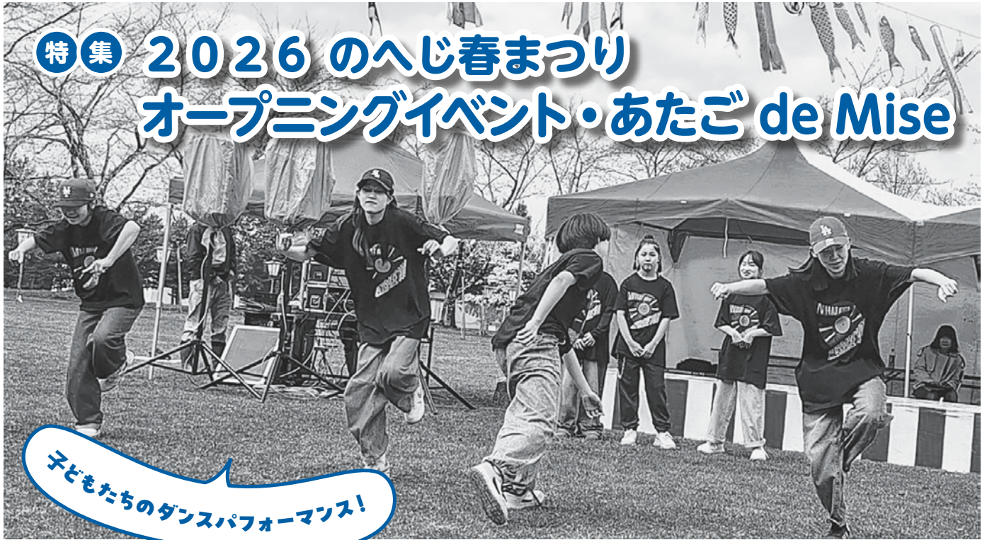
子どもたちのダンスパフォーマンス!

4月18日(土)から5月6日(水・祝)まで、愛宕公園を会場に「のへじ春まつり」が開催されました。