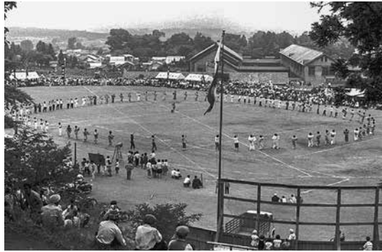
【写真①町民運動会 撮影日：1964(昭和39)年】 町民運動会でササ踊りを踊っている様子。愛宕公園のグラウンドで踊っています。