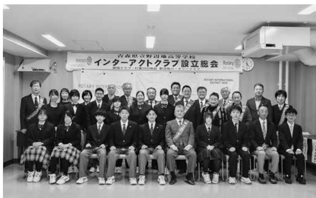
野辺地高校インターアクトクラブ設立総会 記念撮影

4月28日、野辺地高校にてインターアクトクラブ (IAC) の設立総会が開催され、会員の生徒や野辺地ロータリークラブ (RC) の会員ら約30人が参加しました。IACは、国際ロータリーによる青少年育成プログラムの一つです。主に高校生がボランティア活動や海外との交流を通じて国際感覚を養うことを目的としています。野辺地RCによると、町内では1985年に野辺地工業高校 (現・野辺地西高校) がIACを設立しており、野辺地高校が町内2校目の設立となります。