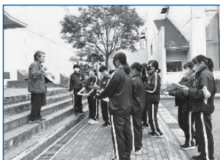
説明を聞いてメモを取る生徒