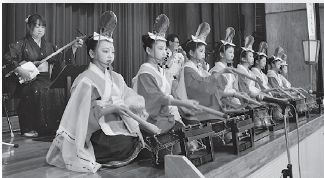
のへじ祇園囃子を披露した下袋町祭典部の皆さん