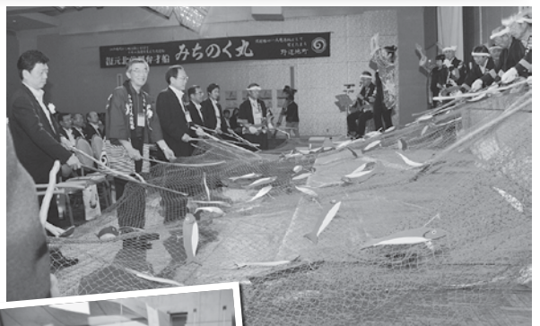
フォーラム参加者も「子叩き音頭」に挑戦！