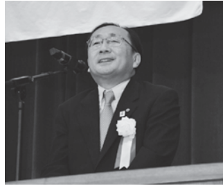
三村申吾知事による祝辞