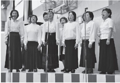
町民歌を歌ってくださった、中央公民館コーラスグループの皆さん