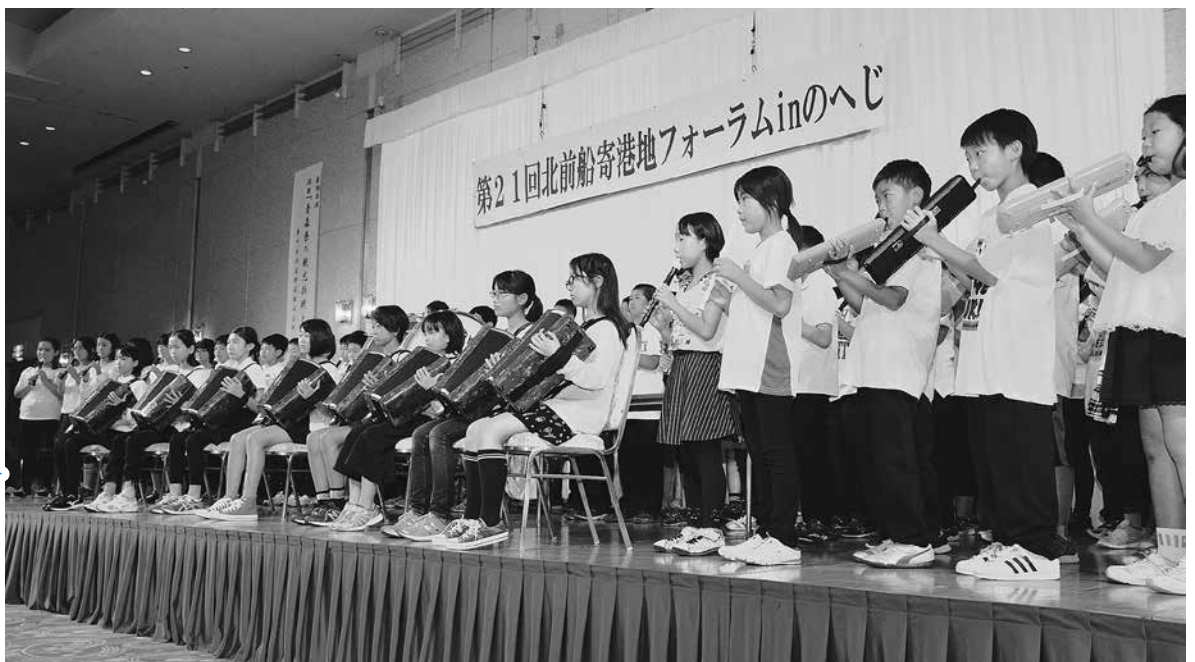
祭り日を演奏する野辺地小学校5・6年生の児童の皆さん