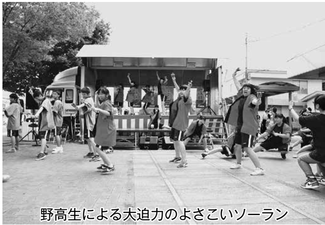
野高生による大迫力のよさこいソーラン