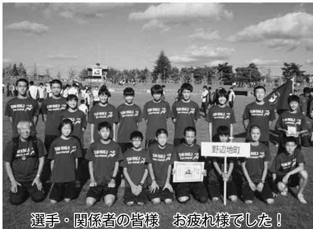
選手・関係者の皆様 お疲れ様でした！