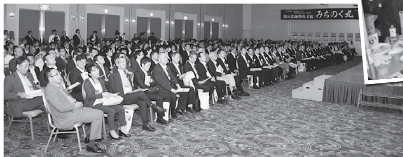
基調講演に耳を傾ける参加者の皆さん