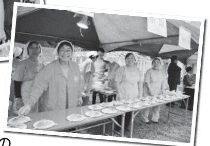
中庭テラスでの特産品の振舞いも大好評でした！