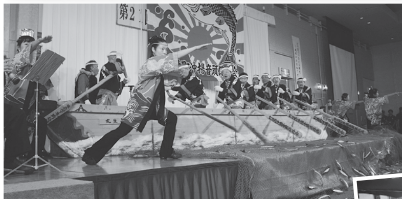
沖揚音頭保存会の皆さんによる沖揚音頭の披露