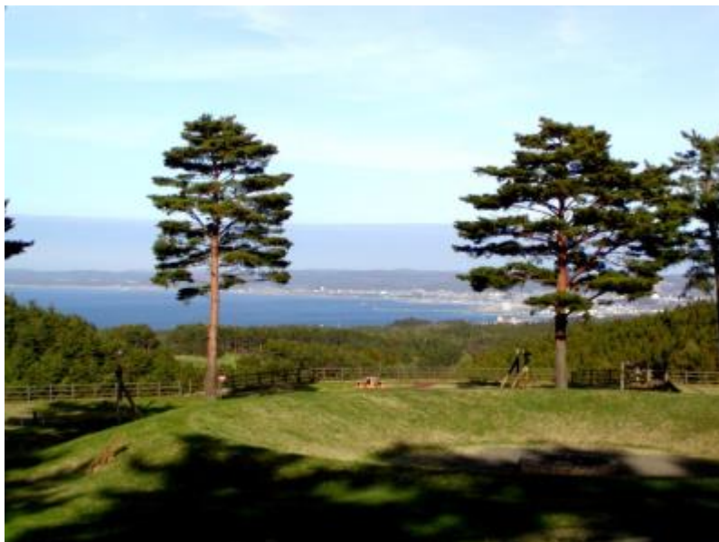
ファイアーサークル周辺