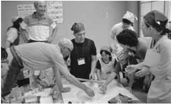
上手に説明できるかな？