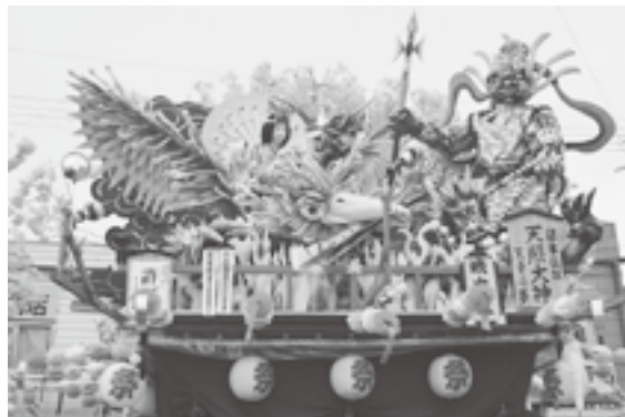
優秀賞 城内組祭典部 「日本伝説 天照大御神、天子の夢」