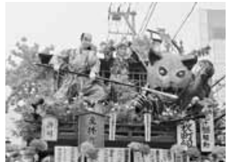
流粋賞 袋町祭典部 「鍋島 化け猫 騒動」