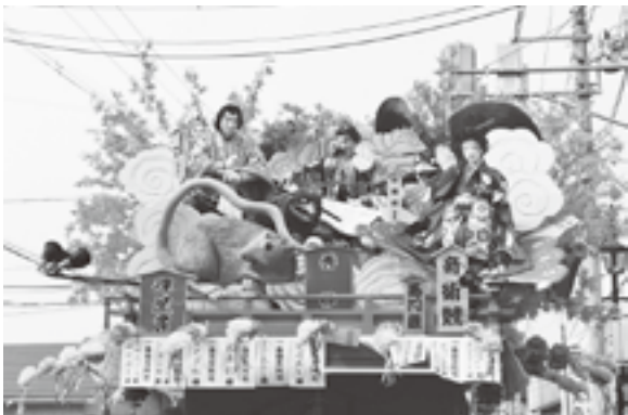
秀作・輝星賞 馬門組祭典部 「奇術競」