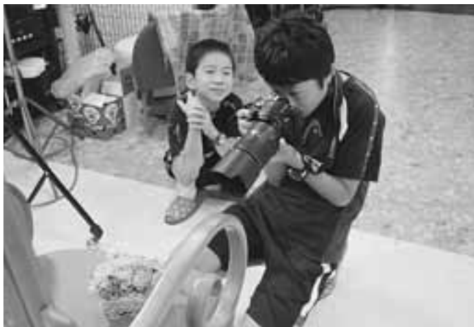
真剣！うまく撮れるかな？