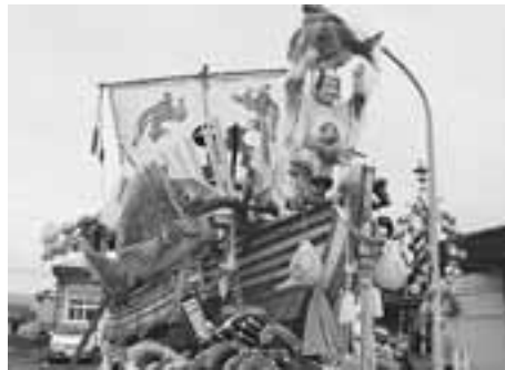
浜町組祭典部 「宝船」