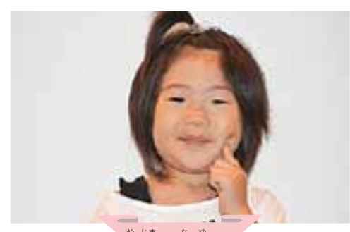
やじま 矢島 凧悠ちゃん なゆ