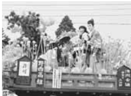
野西高組祭典部 「清州会議 秀吉と三法師」