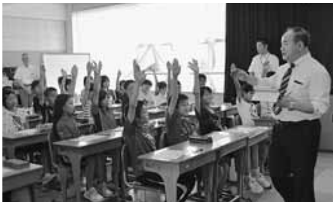
積極的に発言する児童たち