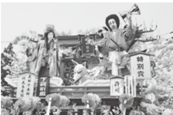
特別賞 下袋町祭典部 「義経千本桜 伏見鳥居前」