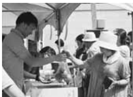
ふるさと物産テント市