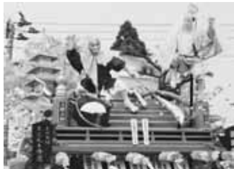
駅前組祭典部 「五条大橋 牛若丸と弁慶」