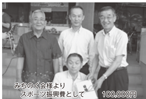
みちのく会様より スポーツ振興費として 100,000円