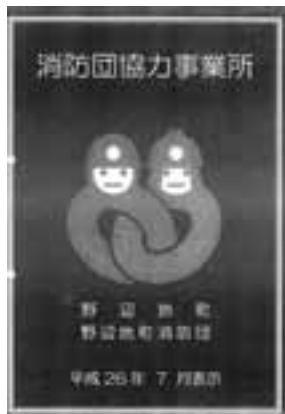
消防団協力事業所の表示証