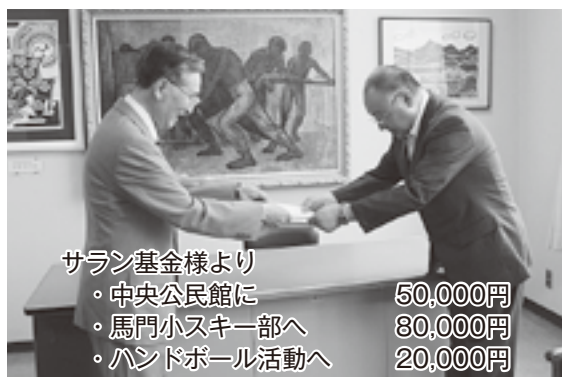
サラン基金様より ・中央公民館に 50,000円 ・馬門小スキー部へ 80,000円 ・ハンドボール活動へ 20,000円