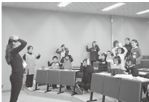
ファミリー・イングリッシュの様子