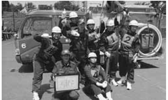
県大会でも優勝目指します！

消防団員の消防技術の向上と士気の高揚を図り、円滑な消防活動に寄与することを目的に、上十三地区消防操法大会が7月27日六戸町の六戸町総合運動公園で開かれ、野辺地町消防団第6分団が消防ポンプ自動車操法の部で初優勝しました。 大会にはポンプ車両と5人の隊員で構成されるポンプ車操法と、可搬型小型ポンプと4人の隊員で構成される小型ポンプ操法の2種目に7チームが参加し、大きな掛け声ときびきびとした動作で消火活動を再現しました。 第6分団は、8月28日に青森市の青森県消防学校で開かれる青森県消防操法大会に、上十三地区代表として出場します。