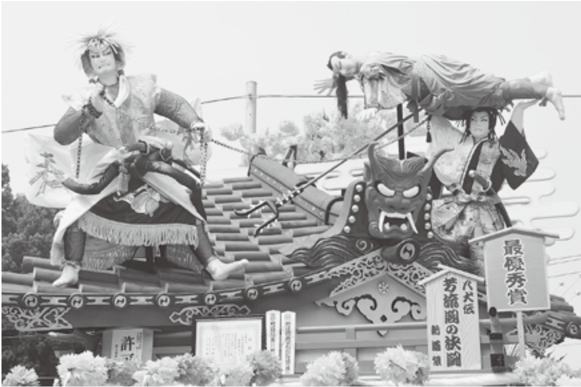
最優秀賞 新道組祭典部「八犬伝 芳流閣の決闘」