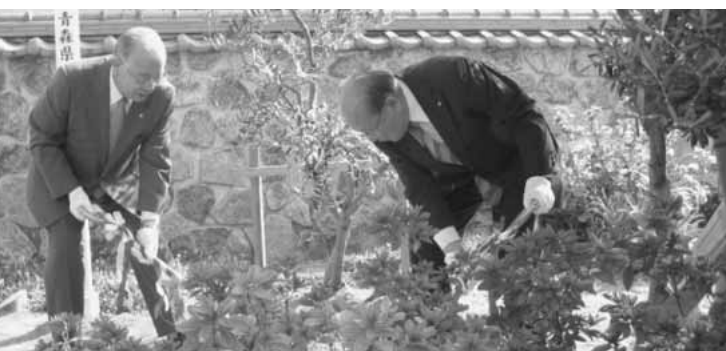
記念植樹する亀田町長(左)と岡田町長(右)