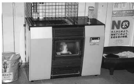
環境にやさしいペレットストーブ 役場税務課前と企画財政課内に設置

いただきました。今年度の目標を、対象者の40%1,600人として実施しましたが、結果は800人弱に終わりまりました。受診率は、20%弱となりました。なぜこのような結果になったのか、現在、未受診者3,400人にアンケートを実施しております。今後は、結果を分析して来年度の受診率向上に向け準備していきたいと考えております。 回答徴収方法として、1つ目は、納税組合の育成。2つ目は、臨