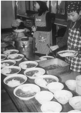
給食当番が盛り付け

町立学校給食共同調理場では、この度、小・中学校を対象に「ふるさと産品給食の日」を、11月20日に開催し、野辺地産食材、県産品を使った、(海鮮風)ホタテと初雪たけ入りカレーライス(福神漬)、リンゴ入りヨーグルトサラダをつくり、児童、