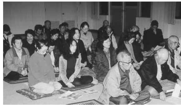
有戸学習等供用センターにて

質問 19年度決算に係る、町の財政状況健全化判断比率説明に対する、国民健康保険特別会計の説明を求めます。 回答 平成19年度の、国民健康保険事業特別会計の決算については、先の9月議会において審議し、歳入歳出差し引き14,903,885円の剰余金が出ました。