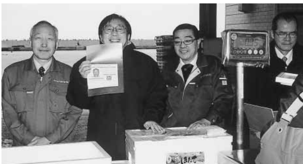
顔の見える漁業トレーサビリティをPR