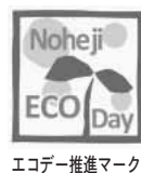
エコデ推進マーク

最後になりましたが、この一年が町民のみならず、一年が実り多き輝かしい年になりますよう、心からお祈り申し上げます。年頭の挨拶といたします。