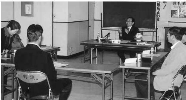
漁業関係者と意見交換