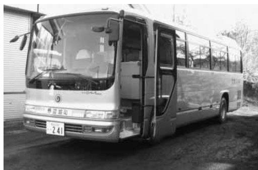
購入された大型バス