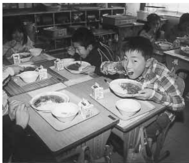
ハイポーズ!! うまく撮れた?

生徒に試食してもらいました。児童たちは、「肉もいけどホタテもなかなかイケル、グー!」とか「カレーはやっぱり肉ダレ、でも美味しいです」と、言いながらお代わりをしていました。