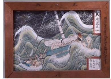
危険な航海の様子（加賀市）

熟練の操船技術を持つ船乗りにとっても、嵐にあえば「板子一枚下は地獄」の恐怖にさらされます。商品を無事に運べば多額の利益を得られる北前船も沈んでしまえば一巻の終わり、全財産を失う船主もいました。危険と隣り合わせの航海は、安全を神仏の庇護に求め、寄港地の中心や小高い丘には神社や寺院があり、港と並行に寺院が建ち並ぶ町もあります。ここでは、航海の無事を祈願した船絵馬や船模型、中にはちょんまげを奉納した「髻額」が奉納されています。また、境内には遠く離れた国名や問屋名