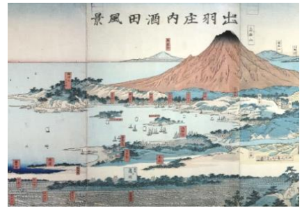
山を仰ぐ港 (酒田市)

一つは、山を借景として大きな川の河口に位置する「山を仰ぐ」港です。日本海から仰ぐ名山は、古くから航海の目印となり、その近くに港を築いています。これらの港は江戸時代には、上方への年貢米の積出港となり、領内の穀倉地帯を流れる大河の河口に米倉、番所などが整備されました。名山を仰ぎ大河に抱かれる港が、日本海を經由し