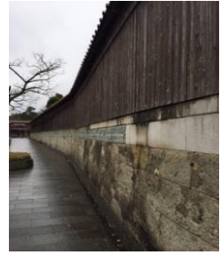
船主達が築いた町（加賀市）

解放を与えた花街や、日和を見た小高い山、航海の安全を祈った神社仏閣など、北前船がもたらした機能が整えられています。そこには、封建下にあつて近隣の稲作を中心とした農村や、その基盤上にある城下には見られない、海上輸送という手段を手にした商人たちの築いた町があります。想像もできないほど高い塀や、敷地内に多くの土蔵を持つ豪壮な屋敷を見て、「こんな所になぜ、こんな大きなお屋敷が」と言った、驚きや発見に出会うことができます。