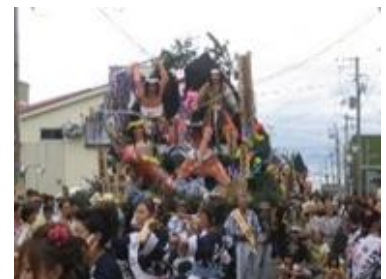
今でも賑わう港の祭り（秋田市）

北前船は生活必需品に加え、雛人形などの高級品、そして様々な文化を運んでいます。天候に左右される北前船の航海は、「風待ち」という文化により、出港までの間、料亭や茶屋などでの一時の出会いと別れと共に、そこで唄われる民謡など各地の芸能が船乗りたちによって伝わっていききました。代表的なのが、「おけさ」や「あいや節」などと呼ばれる哀調を