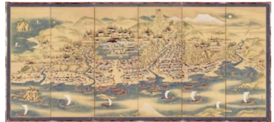
当時の町の賑わい (松前町)

もう一つは、山と海の間のおずかな平坦地に位置する「山に抱かれる」港です。一度の航海で巨万の富が得られる北前船が頻繁に行き交うようになると、風待ち港も含め多くの寄港地が整備されました。砂丘の多い日本海沿岸では、山と海に挟まれたわずかな平坦地を利用し、コンパクトな港や集落を築いています。古い建物や荷揚場、船止めの杭など、北前船によりもたらされた、文化遺産が集約された町並を歩いて回ることができます。