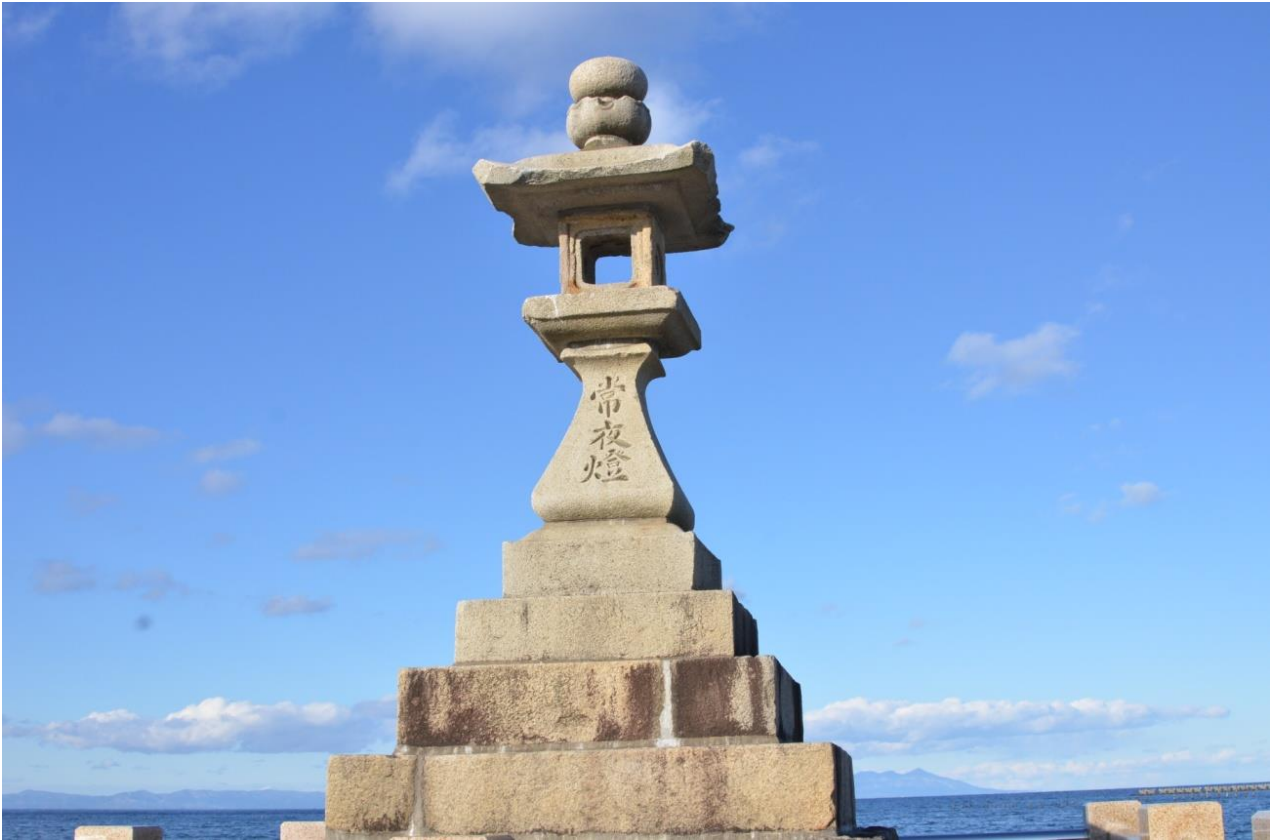
常 夜 燈